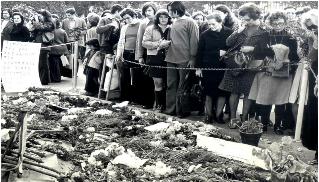
La première célébration du soulèvement de l'Ecole Polytechnique, le 17 novembre 1974

sur la question du régime politique en 1974, le mouvement féminin et féministe, la première célébration du soulèvement de l'Ecole Polytechnique etc.).